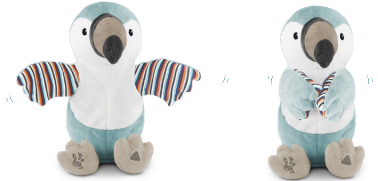
Timo the toucan

B Drücken Sie den RECHTEN FUSS und spielen Sie das interaktive Klatschspiel: Chloe und Timo klatschen in die Hände, während sie singen: 'Clap clap clap your hands, clap your little hands!'