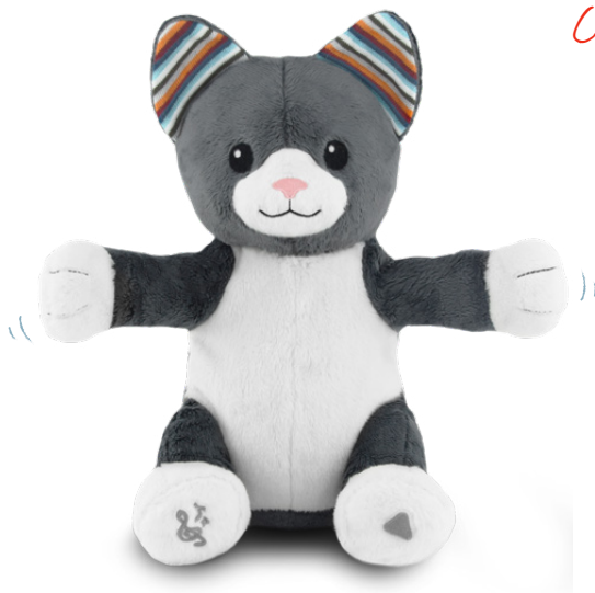
Chloe the cat